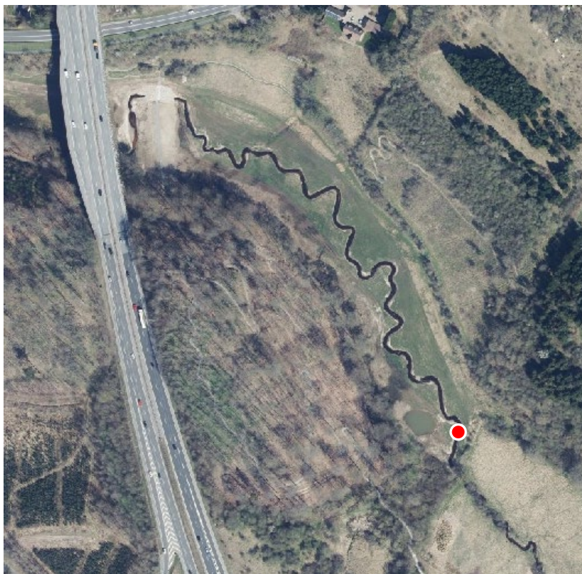
Placeringen af gangbroen over Seest Mølleå er markeret med en rød prik