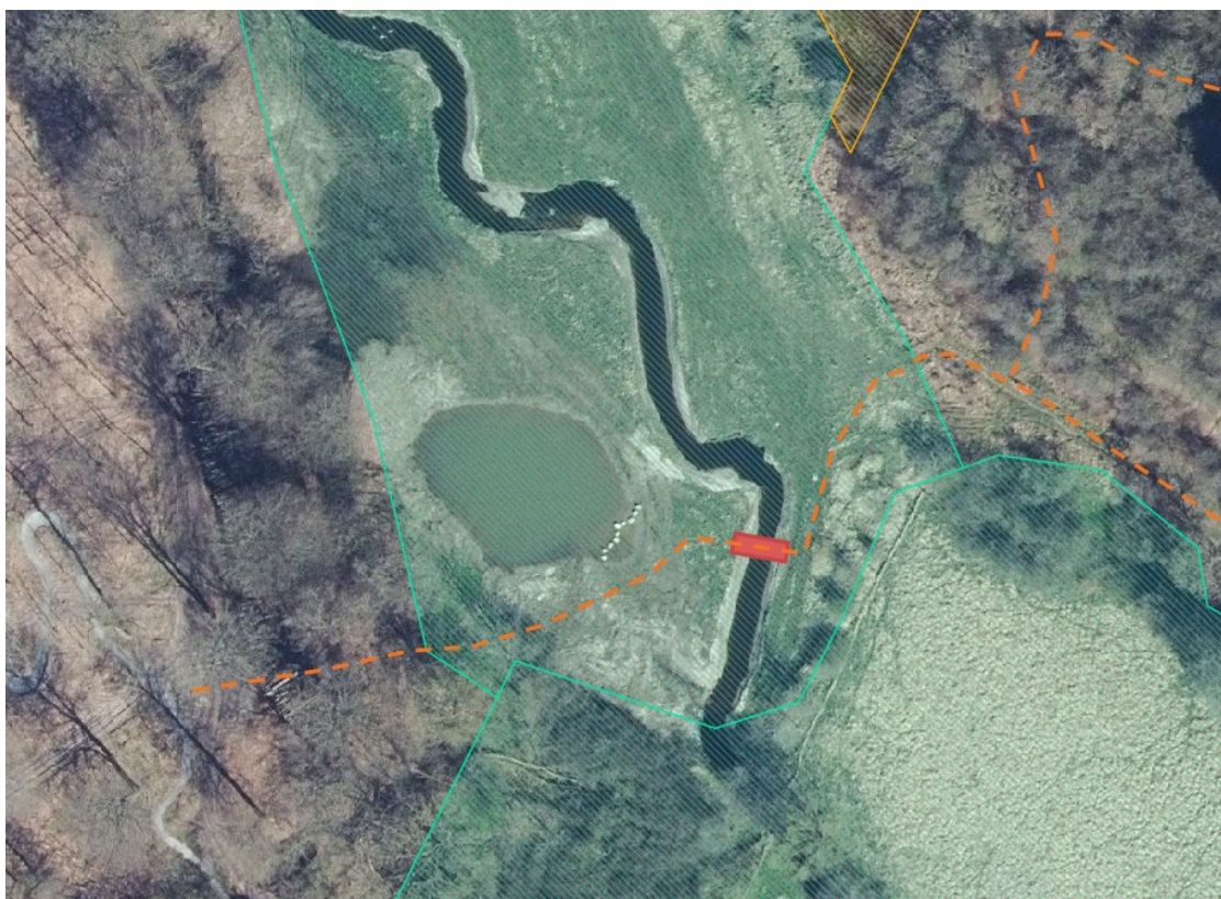
På luftfoto fra 2022 er trampestien indtegnet med orange og gangbroen over Seest Mølleå er indtegnet med rødt. Den beskyttede eng er skraveret med grønt.

Vilkårene er stillet for at sikre, at naturarealerne bliver ved med at være gode levesteder for planter og dyr.